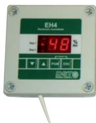
NÄYTTÖ: RJ9 kaapeli, matalajännite, 25m. Jatkokaapelisarja, (max. 200m).