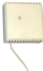
HUONEANTURI: RJ 9 matalajännite kaapeli 3 m. Jatkosarja 25 m RJ 9 kaapeli (max 50 m).