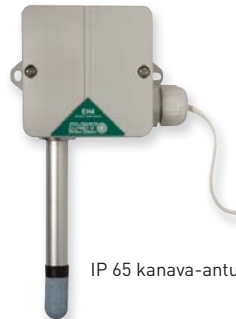
IP 65 kanava-anturi