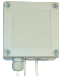
RELE: 230 V syöttö