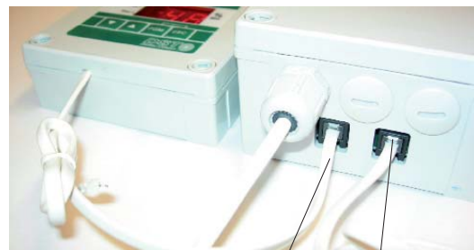
Näyttö kaapeli Anturi kaapeli

25 m matalajännitekaapeli relekotelosta näyttöyksikölle. 230 V syöttö relekotelolle. 3 m anturikaapeli relekotelosta.