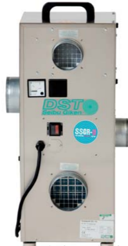
Ilmankuivain Consorb DC-10

Seibu Giken DST AB kehittää ja valmistaa ilmankuivaimia. DST:llä on markkinoiden laajin valikoima kaikenkokoisia kuivaimia, pienistä alapohjankuivaimista räätälöityihin prosessiteollisuuden kojeisiin asti. Seibu Giken DST kuivaimia käytetään ympäri maailmaa suojaamaan ruostumista, kondenssin muodostumista, huurtumista ja muita kosteusongelmia vastaan.